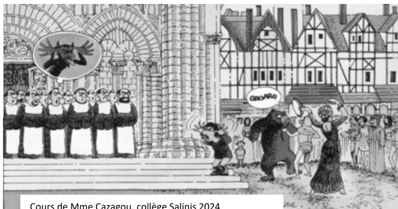
Cours de Mme Cazagou, collège Salinis 2024