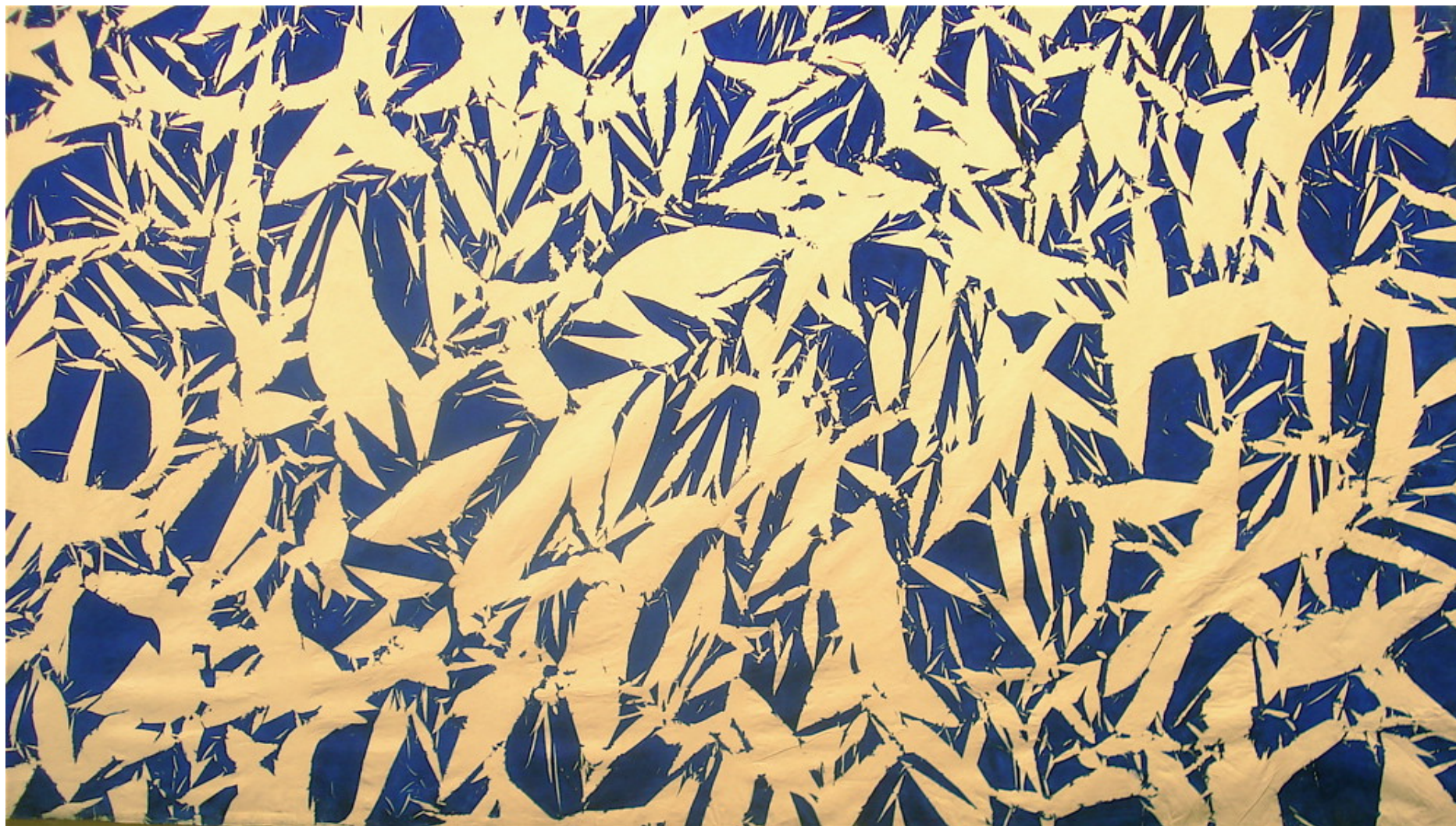
Œuvre de Simon Hantaï 1973