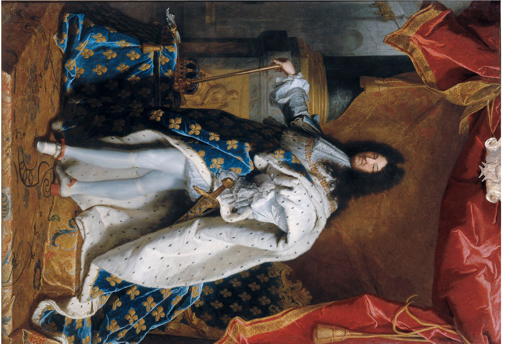
Portrait en pied de Louis XIV Peint par Hyacinthe Rigaud