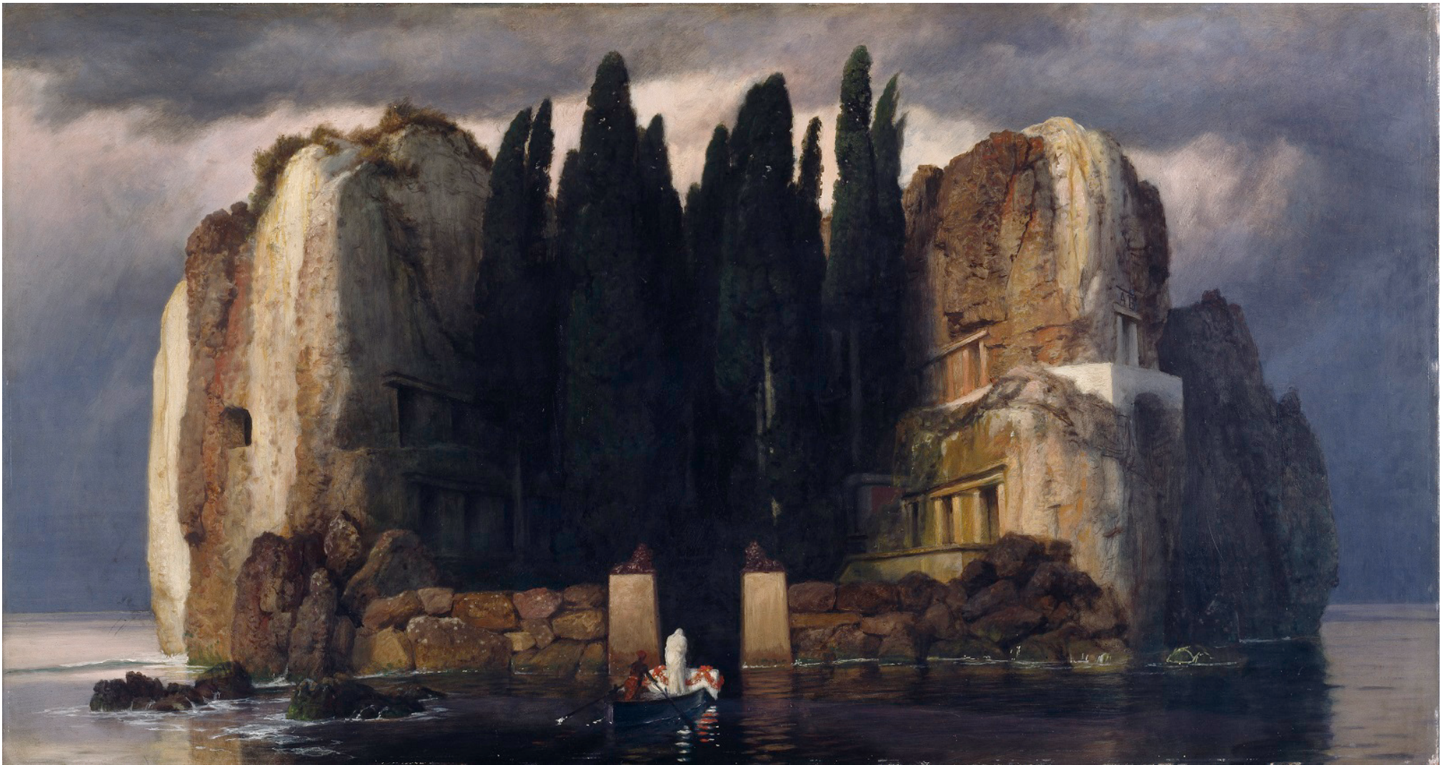
L'œuvre de Böcklin