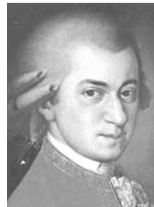
Cours de Mme Cazagou, collège Salinis 2022

Essaye de les distinguer en entourant leurs spécificités.