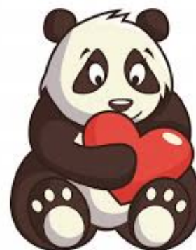
Cours de Mmes Cullet et Cazagou, collège Salinis, Mai 2020

Au lieu de Dans le feu de la jeunesse naissent les plaisirs on va chanter En ces temps confinés, on aime cuisiner Au lieu de Et l'amour fait des prouesses pour nous éblouir on va chanter Des Donuts au chocolat avec du nougat Au lieu de Oui mais sans la tendresse l'amour ne serait rien on va chanter Oui mais le manger sans toi, ça serait déprimant Au lieu de Non, non, non, non l'amour ne serait rien on va chanter Non non non, je ne le pourrai pas