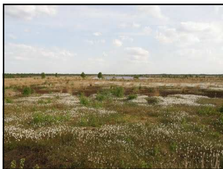
Les marais de l'Emsland vers Papenburg.

http://www.youtube.com/watch?v=wH9I2Lyf6dY&feature=related