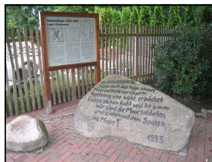
Stèle commémorative à l'entrée du mémorial du camp de Börgermoor. Photo sur Panoramio de L.Willms.

Document Catherine Poncelet, professeur relais, pour le musée de la Résistance et de la déportation/Archives départementales du Cher.